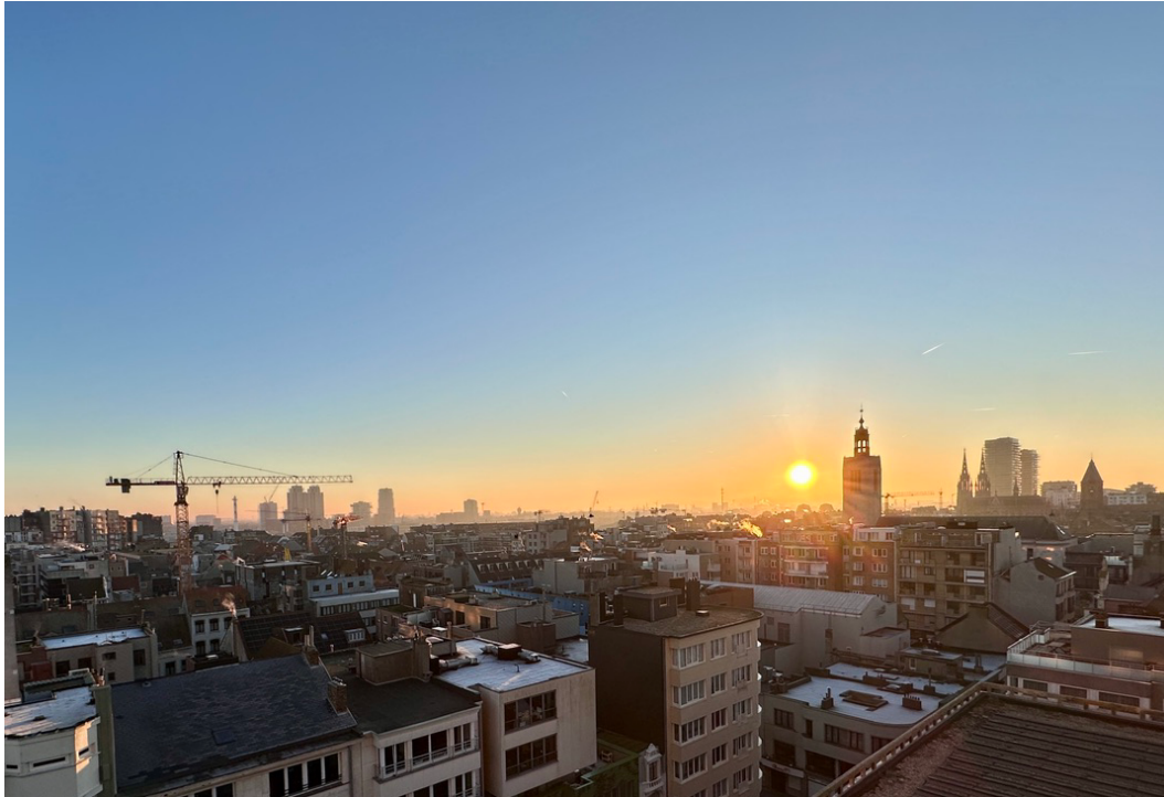
vue de la chambre à coucher sur le centre-ville, au lever du soleil