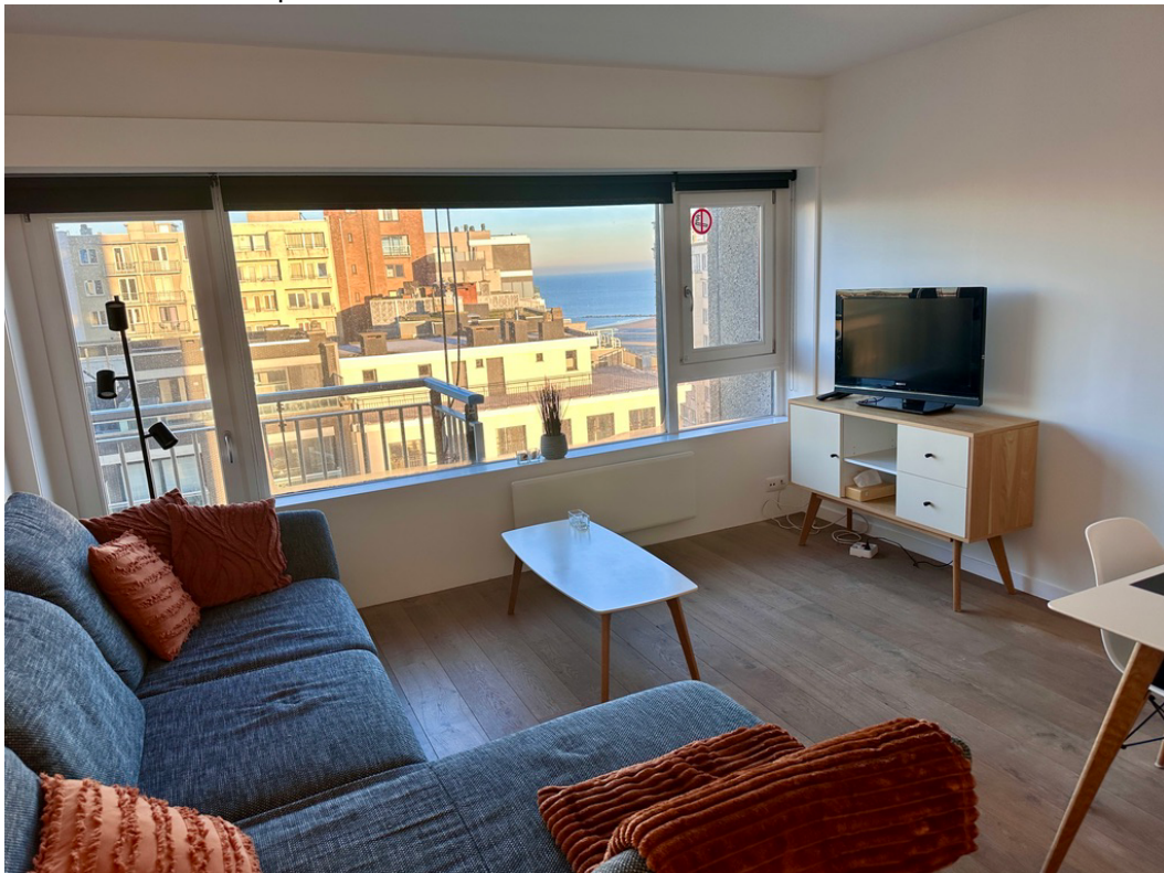
vue du salon sur la plage et la mer

tous les matelas ont des protections, veillez à ne pas les prendre accidentellement avec vous lorsque vous enlevez les draps