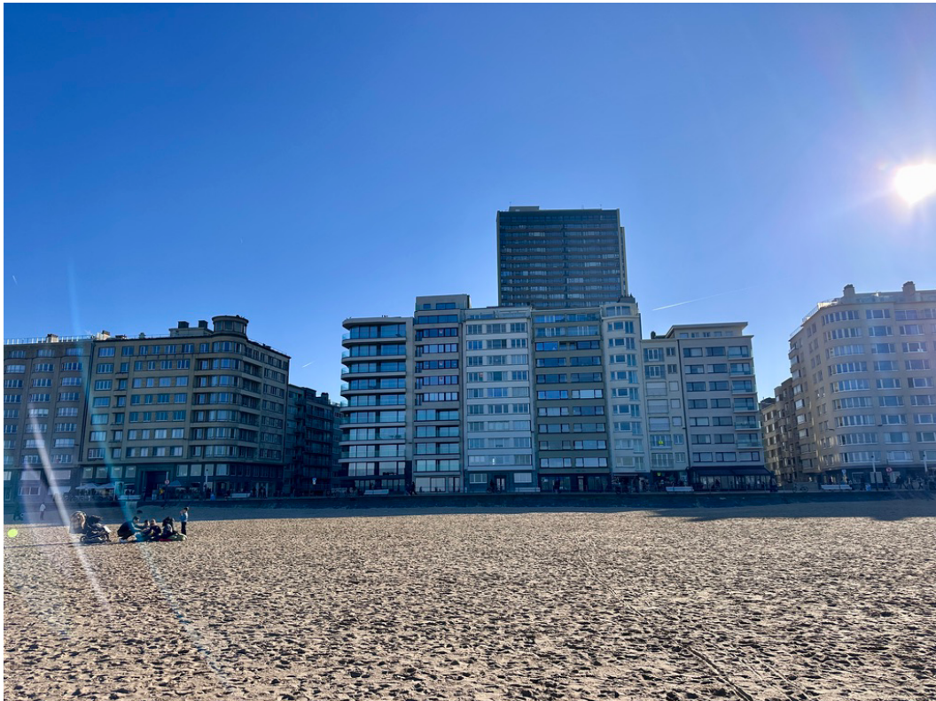
vue de l'Europatoren depuis la plage

Appartement de 2 chambres au dixième étage avec ascenseur, cuisine moderne équipée, télévision digitale, internet et une terrasse avec vue sur la mer.